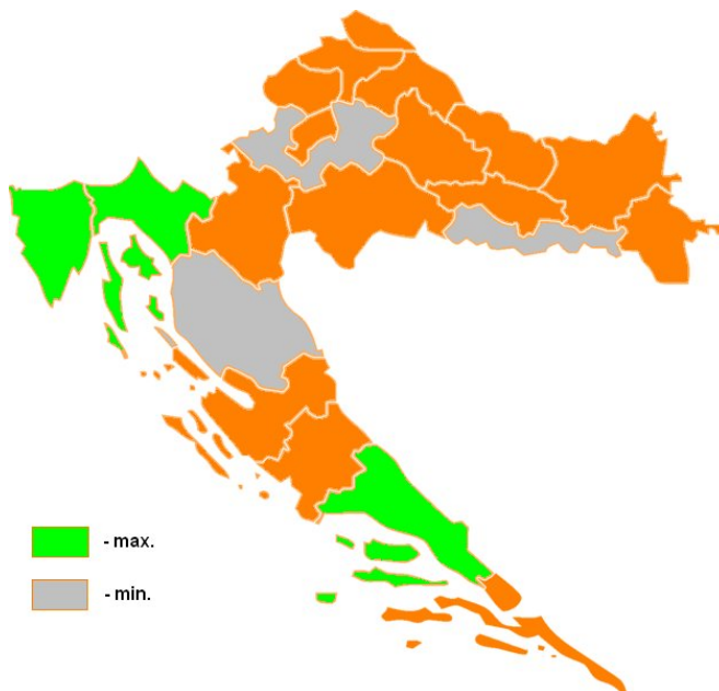
Karta 1: Županije s najviše i najmanje bratimljenja

Od lokalnih jedinica gradovi, u odnosu na općine, imaju znatno više pojedinačnih bratimljenja. Niz predvodi Zagreb sa 11 europskih bratimljenja, za njim slijede Vinkovci (9), Varaždin (8), te Split, Šibenik, Osijek i Pula (6). Pritom, važno je napomenuti da spomenuti gradovi, kao i većina onih koji su do sada ostvarili bratimljenje, imaju bratimljenja koja uključuju i gradove izvan Europske unije, a što nije bilo predmetom ovoga istraživanja. Od općina, prvo mjesto s najviše europskih bratimljenja zauzima općina Cestica (Varaždinska županija) – 7 bratimljenja koje je uspostavila sa slovenskim općinama.